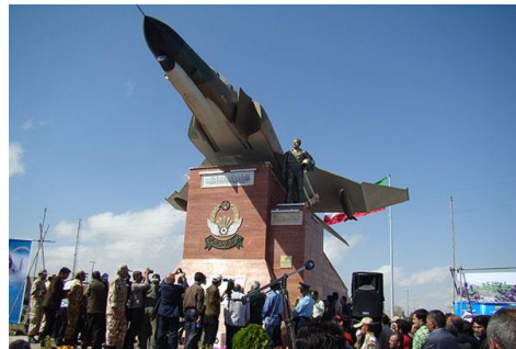
شکل ۴: تندیس شهید خلبان غفور جدی

البته در این المان سازی آنچه که ضرورت دارد برقراری فضای با نشاط برای حضور مردم و شکل دهی یک المان و نماد برگرفته از تاریخ، فرهنگ و هویت این منطقه است که به عنوان ضرورت این پژوهش نیز محسوب می گردد. در بسیاری از کشورها میادین مشخص مانند میدان فرش شکل می گیرد تا فعالان این هنر-صنعت در آن حاضر شده و حتی کسب درآمد کنند ما در شهر اردبیل به میادینی نیاز داریم تا درکنار حفظ هویت و تاریخ و قدمت اردبیل، مردم با حضور در آن فضاها احساس رضایت و نشاط کرده و باعث رونق گردشگری و افزایش حس تعلق افراد و همچنین افزایش تبادلات اجتماعی در فضاهای عمومی شهری گردد.