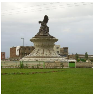
شکل ۳: تندیس عروج میدان جانبازان

و هم چنین شهردار اردبیل یکی از نمادهای شهر اردبیل را میدان جانبازان برشمرد. تندیس عروج میدان جانبازان: تداعی اصالت‌های ملی و محلی از فرهنگ پیشین یک کشور یا منطقه.