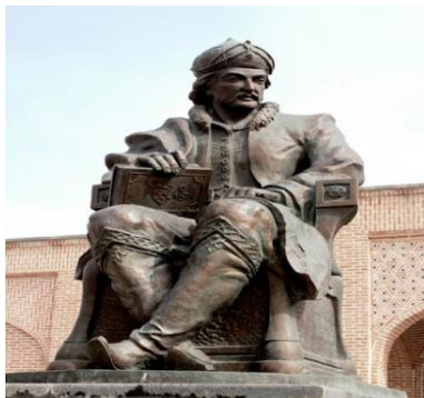
شکل ۲: تندیس شاه اسماعیل صفوی

معرفی آثار تاریخی و محلی شهر نقش تعیین کننده‌ای دارد که با هزینه‌ای بسیار اندک می‌توان از این هنر به نحو مطلوب استفاده کرد و شهر را باارزش‌تر و پراهمیت‌تر به شهروندان و گردشگران نشان داد. محور توسعه اردبیل صنعت توریسم و کشاورزی است که باید این دو محوریت هم به شهروندان هم به مسافران معرفی شود. با بیان اینکه در شهرها و استان‌های دیگر از محصولات تولیدی کشاورزی آن استان به عنوان نماد شهری استفاده شده است. می‌توان تصریح کرد وقتی محوریت توسعه استان کشاورزی است می‌توان برای معرفی کیفیت بالای محصولات کشاورزی نمادهای ترکیبی از این محصولات را در معابر مورد استفاده قرار داد. یکی از نمادهای شهر اردبیل نشان میدان مادر است چون این نشان تندیس شخصیت خاصی نیست بلکه نشان از مهر مادری است که می‌تواند به عنوان نماد معرفی شود. هرچند تعداد نشانه‌های موجود در میدان و معابر شهر اردبیل کم است اما نباید ادعایی در مورد آنها داشت (جمالی و طالبی، ۱۳۹۳:۹). تندیس شاه اسماعیل صفوی: باتوجه به اینکه شاه اسماعیل در اردبیل حکومت می‌کرده است وجود نماد شاه اسماعیل می‌تواند هویت تاریخی اردبیل را احیا کند که نشان از قدرت پادشاهان، ویژگی‌های شخصیتی اسطوره‌ها و شخصیت‌های علمی و فرهنگی می‌باشد.