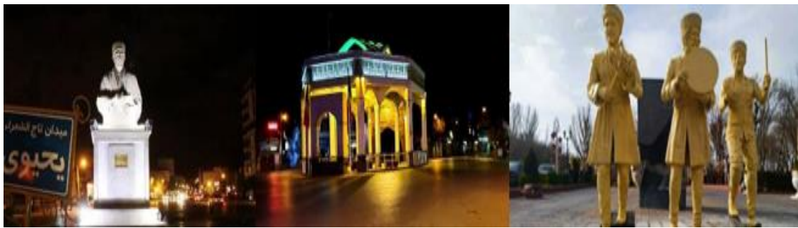
شکل ۹: نمونه تصاویر از المان‌های فرهنگی - محلی در شهر اردبیل

با میانگین ۳/۹۶ براساس نتایج آزمون درصد متوسط به بالایی را دارد. که با دیدن این مجسمه‌ها و تندیس در فضای شهری بانوان نشاط بهتری در این مکان‌ها دارند. براساس میانگین آزمون نیز همانطور که در نمودار مشاهده می‌شود بیشترین درصد میانگین به مجسمه‌های مشاهیر مربوط می‌باشد.