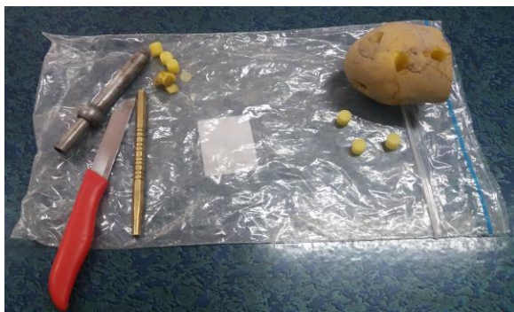
شکل ۱- برش نمونه و آماده سازی جهت آزمون فشار

ابتدا ۵ رقم مختلف سیب زمینی (آگریا، اسپریت، سانته، مارفونا و جلی) از مرکز تحقیقات کشاورزی اردبیل و بلافاصله پس از برداشت تهیه شدند. پس از تهیه ارقام، ابتدا با استفاده از استوانه برش ۲۱ نمونه از هر رقم سیب زمینی تهیه و سپس داده برداری با دستگاه ستنام انجام شد.