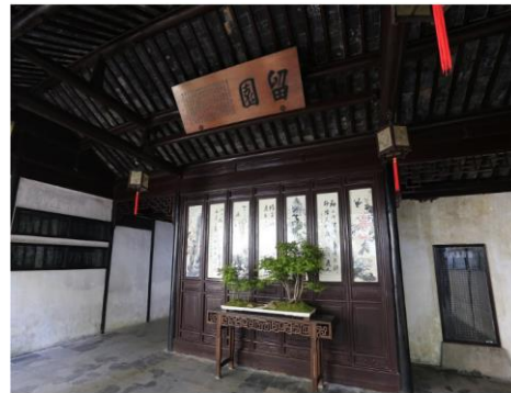
شکل ۱- نمای داخلی ساختمانی در باغ لینگرینگ

باغ لینگرینگ (Lingering Garden) یکی از مشهورترین باغ‌های سنتی چینی (با الهام از طرح‌های ژاپنی) در شهر سوژو است. شکل ۱ و شکل ۲ به ترتیب تصاویری از نمای داخلی یک ساختمان در این باغ را نشان می‌دهد.