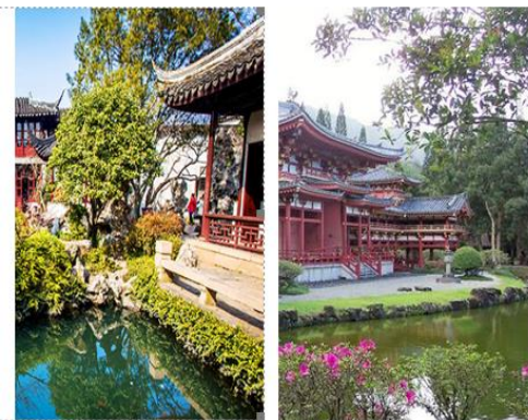
شکل ۳- نمایی از باغ‌های عصر امپراتوری پکن در مقایسه با باغ لینگرینگ شهر سوژو چین (راست: امپراتوری پکن و چپ: باغ لینگرینگ) (chinadiscovery).

طراحی شده است و تمرکز بر زیبایی و هماهنگی در طراحی باغ قرار دارد. بناها و فضاهای مختلف در باغ لینگرینگ به طور یکپارچه و هماهنگ با یکدیگر طراحی شده‌اند، به گونه‌ای که ایجاد یک هماهنگی و همبستگی بصری در باغ را ترویج می‌کنند. از طریق استفاده از عناصر هنری ژاپنی مانند بناهای چوبی، آبنماها، تاج‌مان‌ها و بونسای درختان، این باغ تمایز و همبستگی بصری بین بناها و فضاها را ایجاد می‌کند. بنابراین، باغ لینگرینگ به دلیل تمرکز بر زیبایی ژاپنی و هماهنگی ظاهری، می‌تواند یکپارچگی بصری بیشتری نسبت به باغ‌های سنتی پکن داشته باشد که ممکن است به صورت مجموعه‌های گسترده‌تر و متنوع‌تری طراحی شده باشند.