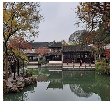
شکل ۲- نمای بیرونی از ساختمان در باغ لینگرینگ

- تنوع مناظر طبیعی و معماری: باغ‌های امپراتوری شهر پکن نیز مانند باغ لینگرینگ، تنوعی از مناظر طبیعی و