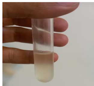
شکل ۱ - کدورت و بیوفیلم ناشی از فعالیت میکروارگانیسم ها در محیط کشت نوترینت برات

آب زیر زمینی: نمونه برداری از آب زیر زمینی محدوده پالایشگاه شیراز جهت آزمایشات میکروبی، مطابق با استاندارد \text{ISIRI-4208} انجام گرفت. از یکی از چاه های در دسترس، نمونه برداری انجام گرفت. نمونه ها در بطری شیشه ای قابل اتوکلاو 1 لیتری و استریل جمع آوری گردید و در ظرف حاوی یخ به آزمایشگاه منتقل و در یخچال نگهداری شد. کشت میکروبی در محیط کشت نوترینت برات تحت شرایط استریل انجام گردید. در همه نمونه ها در اثر فعالیت میکروارگانیسم ها پس از 24 ساعت گرمخانه گذاری در دمای 37 درجه سانتی گراد کدورت ایجاد شد و بیوفیلم نیز در سطح محیط کشت تشکیل شد. در شکل 1 فعالیت میکروارگانیسم ها در محیط مذکور نشان داده شده است.