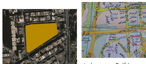
شکل ۲- دسترسی ها و خیابان‌های اطراف سایت دوم

سایت دوم: زمینی به مساحت حدود ۴۴ هزار متر مربع در منطقه ۶ تهران بین اتوبان همت و حکیم و در ضلع غربی اتوبان کردستان در نزدیکی ساختمان اسپ و برج بین‌المللی تهران.