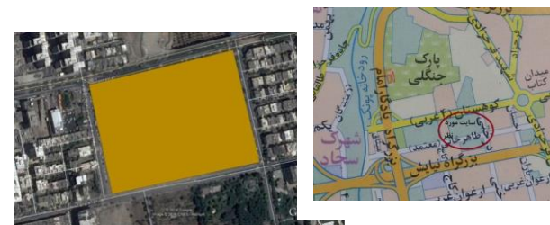
شکل ۳- دسترسی ها و خیابان‌های اطراف سایت گزینه سوم

سایت سوم: زمینی به مساحت حدود ۶۲ هزار متر مربع در منطقه ۲ تهران، سعادت‌آباد، خیابان کوهستان