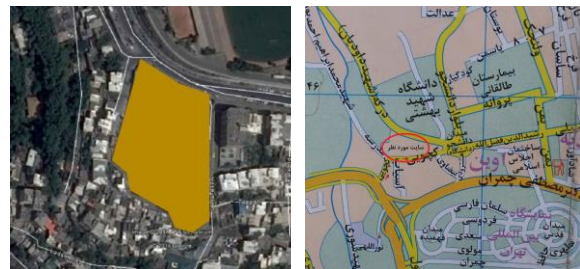
شکل ۱- دسترسی ها و خیابان‌های اطراف سایت گزینه اول

سایت اول: زمینی به مساحت ۱۵۰۰۰ متر مربع در منطقه ۱ تهران، میدان دانشجو، خیابان درکه (شهید داودیان) و در نزدیکی دانشگاه شهید بهشتی قرار دارد.