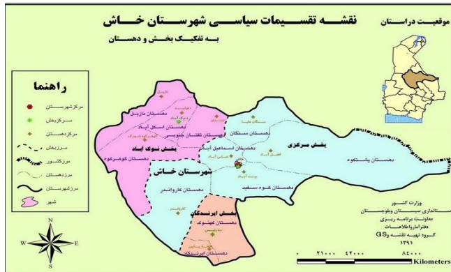
شکل ۱: موقعیت جغرافیایی شهرستان خاش

شهرستان خاش با طول جغرافیایی ۶۱ درجه و ۱۲ دقیقه‌ی شرقی و عرض جغرافیایی ۲۸ درجه و ۱۳ دقیقه‌ی شمالی و ارتفاع ۱۳۹۴ متر از سطح دریاهای آزاد در جنوب شرقی ایران واقع شده است (شکل ۱). نمونه‌برداری از خاک مکان دفن زباله شهرستان خاش در دی‌ماه ۱۳۹۲ انجام گرفت.