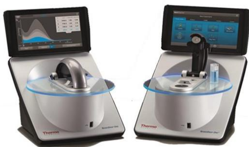
شکل ۱- دستگاه نانو اسپکتروفوتومتر با حجم ۱۰۰۰ میکرولیتر با استفاده از کووت

این عمل با روش اسپیکل صورت پذیرفت به این صورت که در هر نمونه، کربوهیدرات با استفاده از اتانول ۹۵٪ و بر اساس روش اسید سولفوریک استخراج شد. میزان نور جذبی هر نمونه از دستگاه نانو اسپکتروفوتومتر (Nano drop) با حجم ۱۰۰۰ میکرولیتر (شکل ۱) با استفاده از کووت (ساخت شرکت Thermo scientific از کشور USA) قرائت و میزان کربوهیدرات استخراجی بر اساس میکروگرم در میلی لیتر از منحنی استاندارد به دست آمد. از گلوکز برای تهیه منحنی استاندارد استفاده گردید. رقیق سازی پیاپی گلوکز تهیه و توسعه رنگ در ۴۹۰ نانومتر برای غلظت‌های مختلف گلوکز کنترل شده و از یک میلی لیتر آب مقطر به عنوان بلانک استفاده شد. برای محاسبه غلظت کل کربوهیدرات در نمونه‌ها از این منحنی استاندارد بهره برده شد. منحنی استاندارد دارای ضریب تعیین ۰.۹۹۵۵ بود. برای هر نمونه داده برداری‌ها در سه تکرار انجام شد و مقدار طول موج جذب و سپس میزان کربوهیدرات محاسبه گردید.